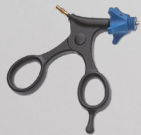
300-450-300 PEEK Polymer Griff, blaue Schraubkappe, ohne Sperre